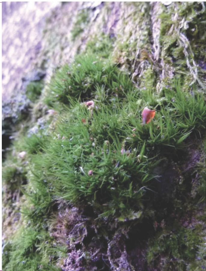
ONF - DF

Dans les Pyrénées, où l'espèce se trouve en limite d'aire de répartition, elle a été observée surtout sur le hêtre, secondairement sur le bouleau et l'aulne glutineux, mais dans le nord-est de la France on la trouve aussi bien sur écorce lisse (hêtre, charme, tilleul, tremble,..) que sur écorce rugueuse (châtaignier, chêne, alisier torminal), et elle est aussi observée sur souche et bois mort.