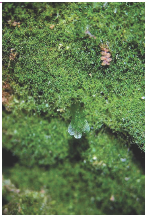
ONF - PH

En dehors de ces conditions optimales, l'espèce peut être présente sous sa forme de prothalle* (gamétophyte), principalement dans des anfractuosités, des falaises, ou des grottes. Elle est alors peu visible et difficilement reconnaissable pour des non-initiés.