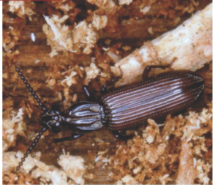
ONF - CVM

Elle se rencontre parfois sur les mêmes sites que Buxbaumia viridis .