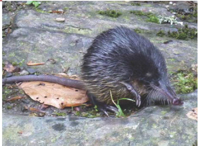
Association Moulin de la Laurède - C.Denier

Les femelles y élèvent leurs jeunes (une ou deux portées supposées pour 3 à 5 jeunes par an).