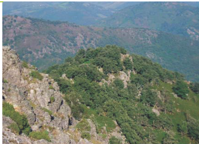
ONF - CC

D'autre part, les peuplements colonisant les terrains pastoraux et qui évoluent naturellement vers une chênaie sessiliflore puis une hêtraie-chênaie mais sont parfois bloqués par pression pastorale ou les feux.