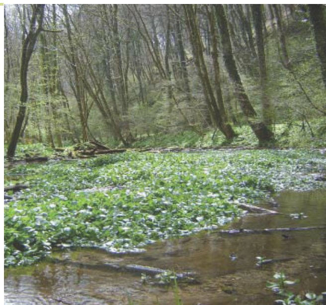
CRPF - ER

La strate arborée est dominée par le chêne pédonculé, les frênes et les ormes. La strate arbustive constituée d'espèces neutrophiles y est diversifiée et recouvrante. Le tapis herbacé est souvent très présent et dominé par les laïches.