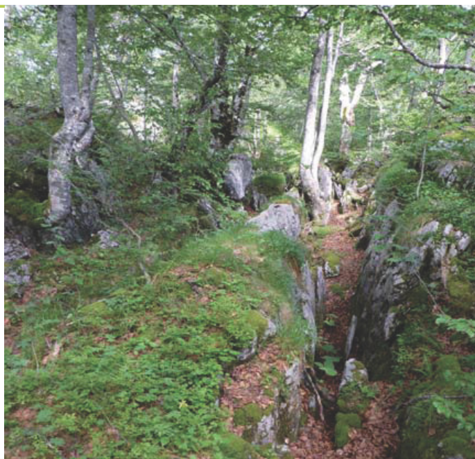
ONF - DF

La strate arborescente est dominée par le hêtre, accompagné par le chêne sessile et/ou pubescent à l'étage collinéen, par le sapin à l'étage montagnard, et par diverses espèces pionnières*. Les strates arbustive et herbacée sont généralement bien développées et diversifiées en espèces calcicoles, sauf dans les couverts denses de buis. Sont notamment présentes plusieurs espèces d'orchidées.