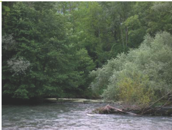
ONF - DF

Cet habitat méditerranéen se caractérise par une strate arborée relativement haute et dense, de composition variée en fonction de l'altitude, de la topographie, du type de cours d'eau... La formation la plus typique est dominée par le peuplier blanc, plus ou moins mélangé avec le saule blanc ou le peuplier noir. On trouve également des formations dominées par le saule blanc, l'Aulne glutineux et/ou le frêne notamment oxyphylle. Subsistent également quelques rares ormaies sur terrasses alluviales. Les strates arbustive et herbacée sont bien développées.