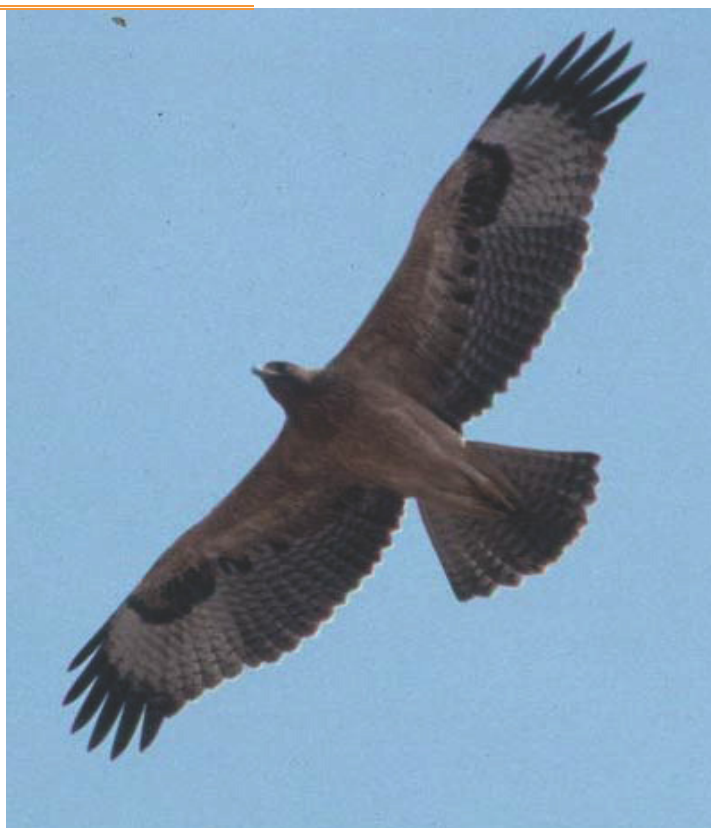
ONF - AP

La femelle pond 1 ou 2 oeufs à 2-3 jours d'intervalle.