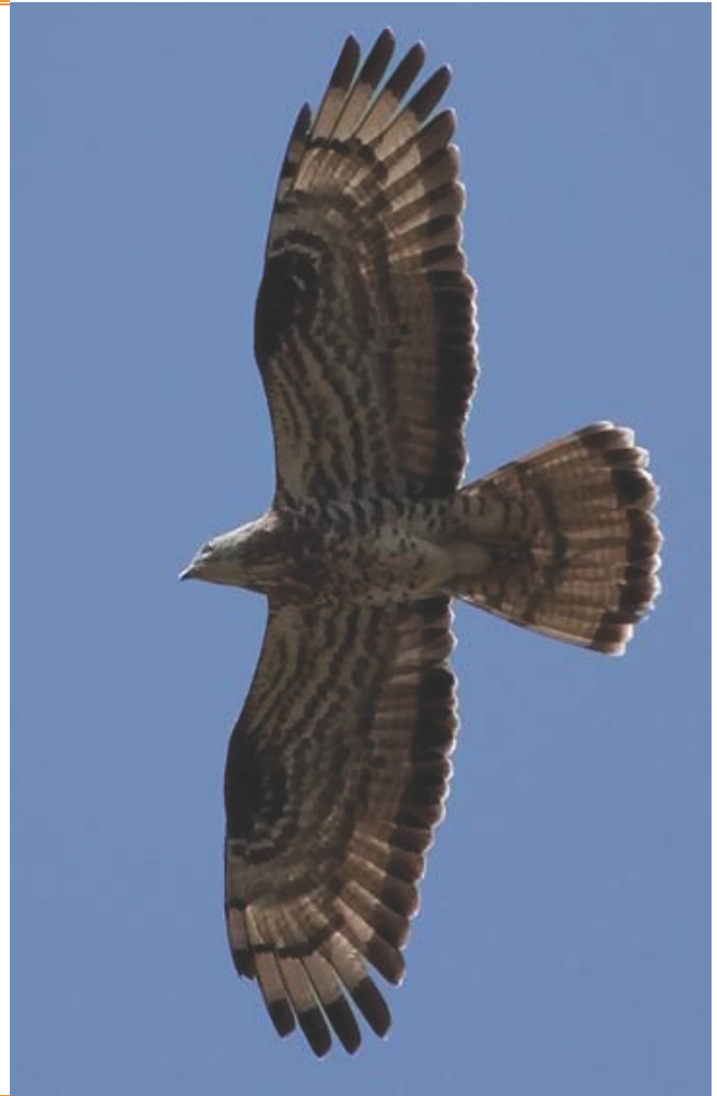
ONF - JT

Migratrice, elle n'arrive en France qu'au mois d'avril et en repart dès septembre.