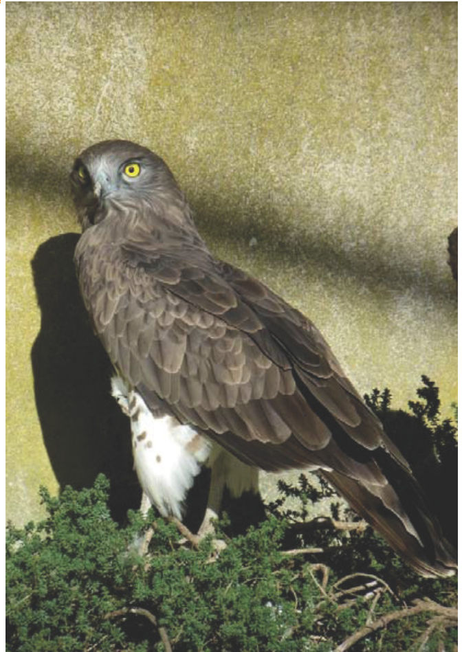
CRPF - ER

Grand migrateur, il arrive en France de fin février à fin mars et en repart entre fin juillet et début novembre.