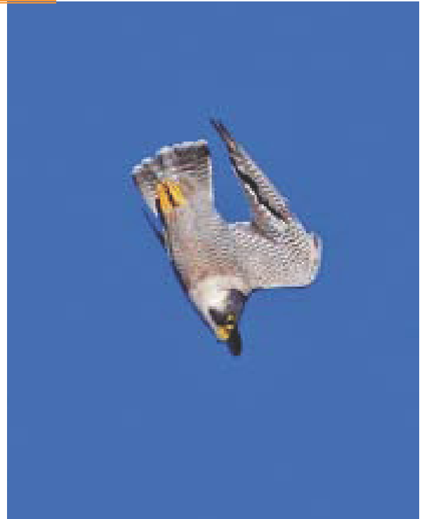
ONF - Mika

L'habitat du faucon pèlerin s'organise autour de sites rupestres, principalement des falaises, nécessaires à sa nidification. Il survole son territoire pour chasser des oiseaux presque exclusivement en vol. L'accès à son aire est en général dégagé mais peut très bien occuper de petites falaises incluses dans les massifs forestiers, voire parfois des constructions humaines. Il y pond de 3 à 4 oeufs. Sans en dépendre, l'espèce côtoie les milieux forestiers mais fréquente moins les grands massifs boisés dépourvus de clairières.