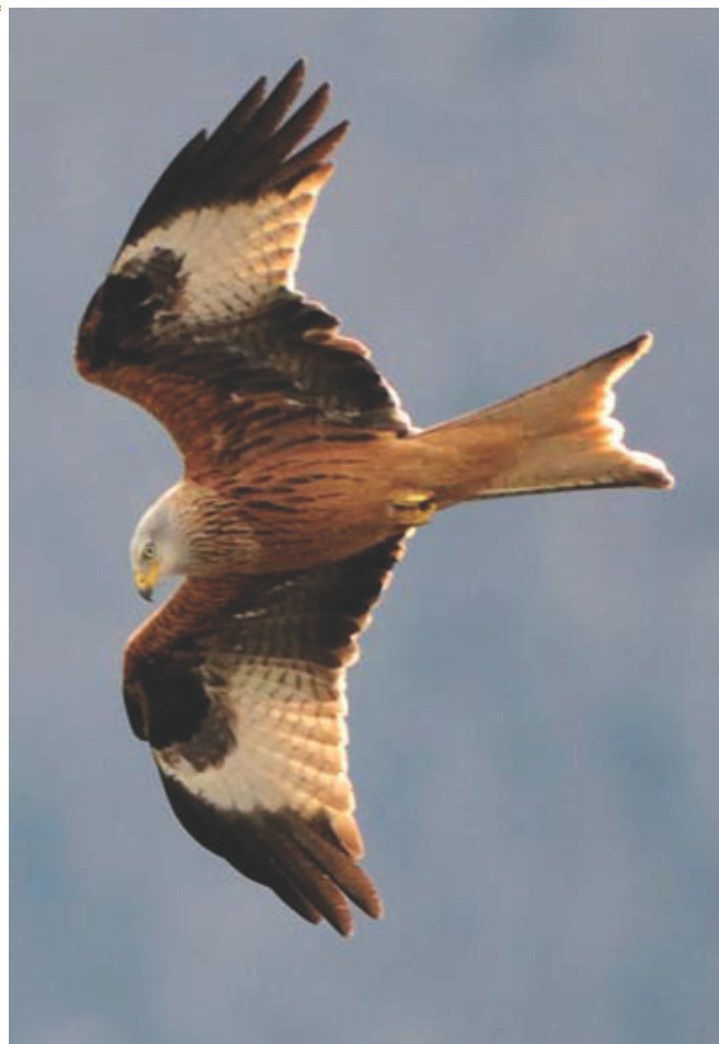
ONF - MiKa

A noter que les populations de cette espèce diminuent fortement depuis 20 ans en France sauf dans les Pyrénées, territoire qui porte par conséquent une forte responsabilité pour sa préservation.