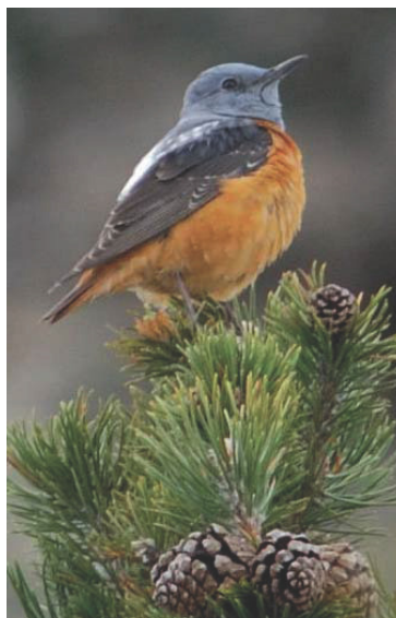
ONF - Mika