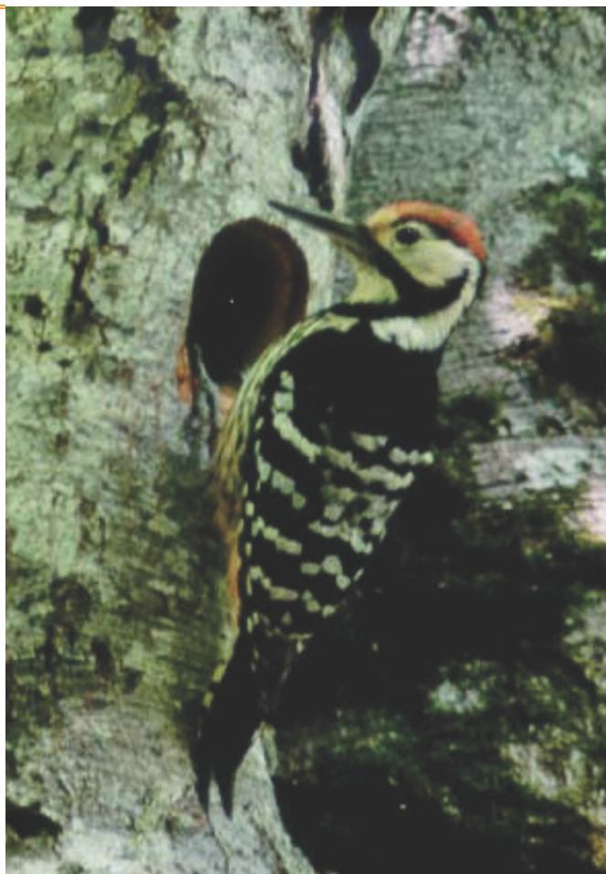
ONF - J-C. Auria

Le nid est installé dans une cavité creusée dans un tronc d'arbre, généralement un hêtre, exceptionnellement un sapin. La ponte est constituée de 3 à 5 oeufs. Les anciennes cavités servent aussi d'abris nocturnes aux oiseaux.