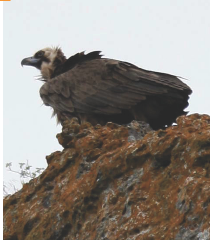
CRPF - D

Ce nid accueille la ponte généralement constituée d'un seul oeuf. Non nicheur dans les Pyrénées, des individus venant des populations catalanes ou cévenoles y sont cependant observés et susceptibles de s'installer.